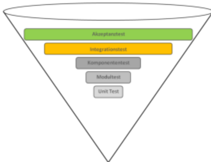
Testfallverteilung als Eistüte

Was in diesem Modell viele Projekte an die Grenzen oder sogar darüber hinausbringt ist, dass sehr viel auch der fundamentalsten technischen Basisfunktionalitäten über die oberste der Testebenen abgesichert werden muss. Wie wir gerade besprochen haben, ist genau das der ungünstigste weil schwierigste und damit zeitaufwändigste Ort dafür. Die Konsequenz ist oft eine unzureichende Testabdeckung, weil zu langwierig.